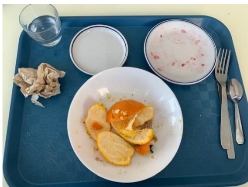
Finir entièrement son assiette