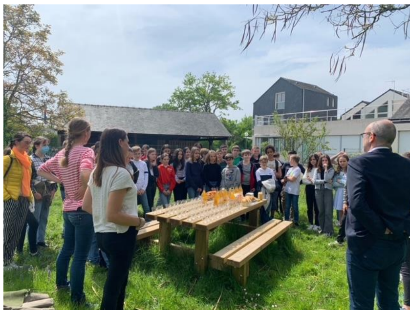
Goûter avec des produits locaux pour les 5C et les 6C

Sur les 595 classes qui ont participé à l'édition, les 5C se retrouvent à la 81 e place et les 6C à la 106 e .