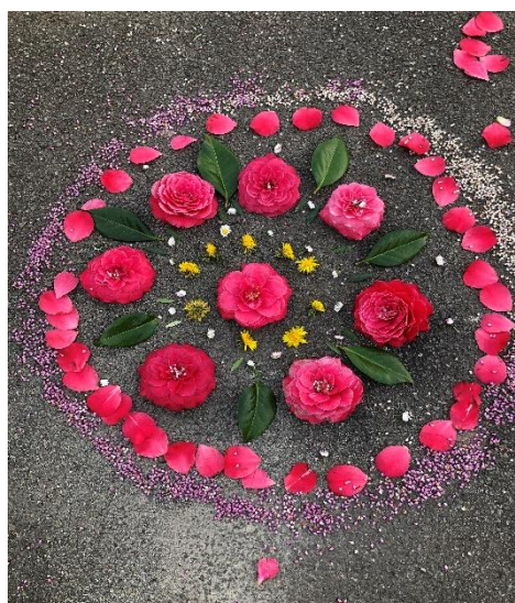
Faire une œuvre d'art avec des matériaux naturels