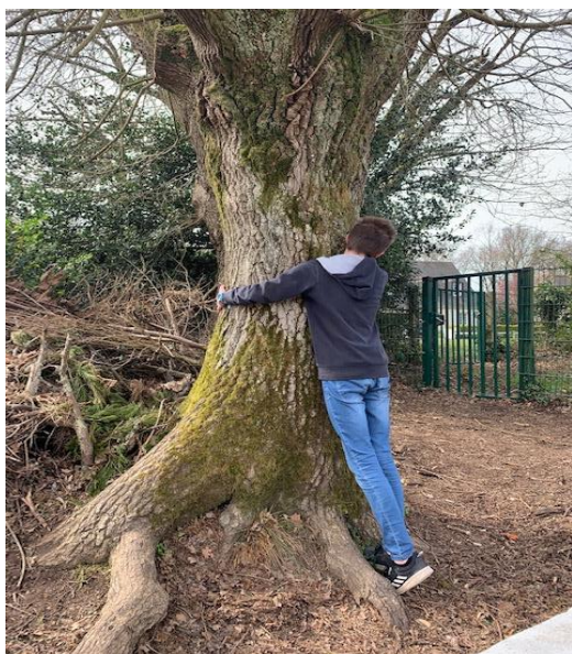
Faire un câlin à un arbre