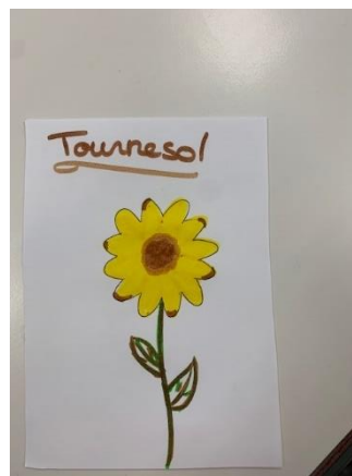
Dessiner une plante mellifère