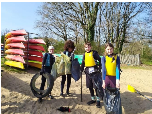
Ramasser des déchets lors d'une balade, ici en kayak