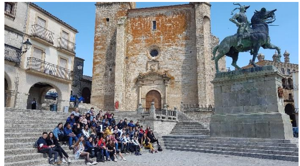
Trujillo, ville de nombreux conquistadores