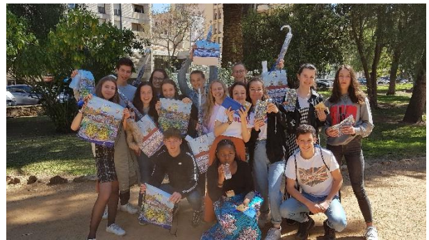
Les gagnants du jeu de piste de Badajoz